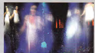
CUSTOMIZED PRO-AV SOLUTIONS