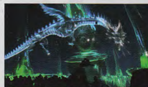
DOME, 360°, 180° PROJECTIONS

Entrust us with complex tasks, rely on our competence and TURN ON SUCCESS.