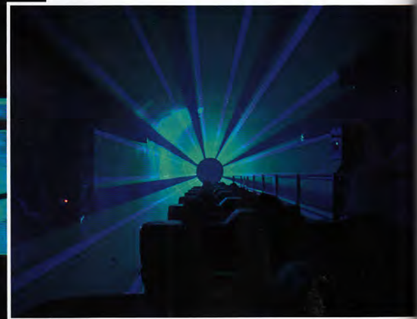
Kurz vor der Ankunft in der Station am Ende der Fahrt erleben die Passagiere einen beeindruckenden Lasereffekt.

Die neue Familienachterbahn „Huracan“ wurde am ersten Saisontag mit einer Eröffnungsshow feierlich in Betrieb genommen.