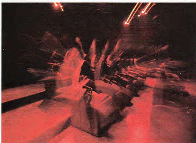
La piattaforma rotante di Nightmare con le sue sedute tematizzate.

con questa giostra Alterface dimostra che il concetto della casa fantasma interattiva in 5D può suscitare lo stesso entusiasmo anche in Europa. Ma mentre Castle of Chaos era stata tematizzata da Clostermann Design, questa volta la scelta è caduta su TAA, un'azienda con radici transilvaniche. Una scelta perfetta per la realizzazione degli effetti animatronici e delle ambientazioni tematizzate, dato che la storyline della giostra è ambientata proprio in Transilvania, dove una star del cinema horror scompare in un castello medievale e mette in moto una serie di eventi soprannaturali.