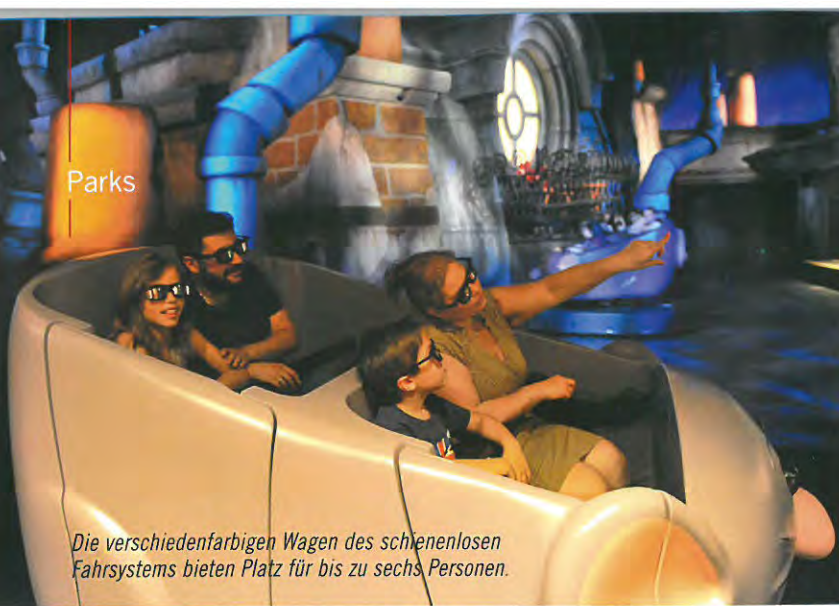
Die verschiedenfarbigen Wagen des schienenlosen Fahrsystems bieten Platz für bis zu sechs Personen.