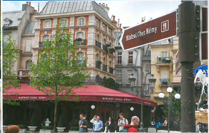
Ein Stück Paris in Paris: Der Place de Rémy mit dem Bistrot Chez Rémy und rechts daneben der Eingang zum Ratatouille-Abenteuer.

Disneyland Paris eröffnet rattenscharfen Familienspaß